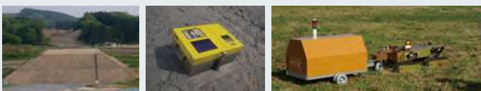
盛土 http://www.netis.mlit.go.jp より 盛土の品質管理を行う計器 RI密度水分計「ANDES」 本体 10.5kg + 電源棒 2kg 計器を搭載した台車を連結した“健気”