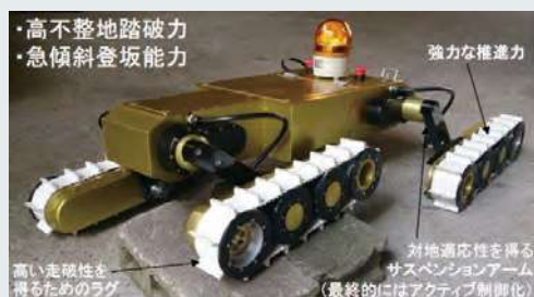
マルチクローラ探査ロボット「健気」