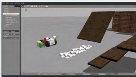
合体変形型移動ロボットのシミュレーション環境の構築