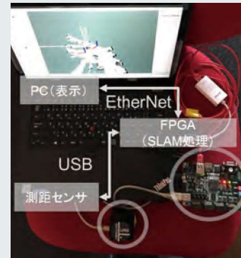
省電力型ロボット計算機システムの検討