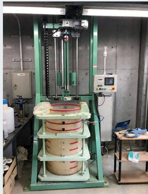
写真1 地上応用を想定した掘進制御の可能な大型掘削試験機