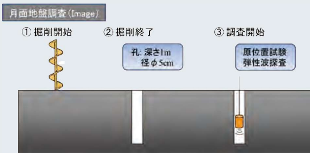
図1 月面地盤調査計画の一例

まず、理論上での掘削時にかかる力学の計算を行い、次に実際に掘削する際のデータを取得した上で、この2つの関係を利用して地盤強度を推定した（図3）。深さ1m程度の任意点で計測可能で安定した推定が可能なアルゴリズムをまとめ、地上の代表的地盤と月の模擬土壌で実験的に検証し有効性を確認した（写真1）。